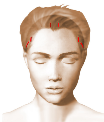
incisions = cicatrices

Chaque chirurgien adopte une technique qui lui est propre et qu'il adapte à chaque cas pour obtenir les meilleurs résultats. Toutefois, on peut retenir des principes de base communs :