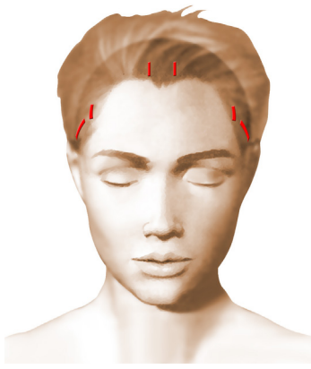
incisions = cicatrices

Chaque chirurgien adopte une technique qui lui est propre et qu'il adapte à chaque cas pour obtenir les meilleurs résultats. Toutefois, on peut retenir des principes de base communs :